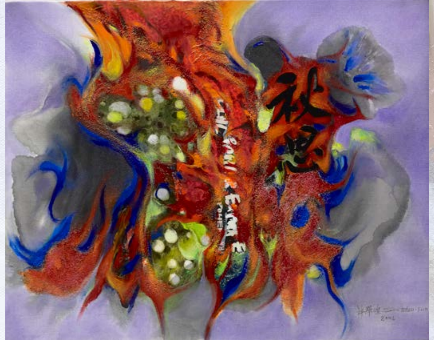
秋思 2004 油畫 10F