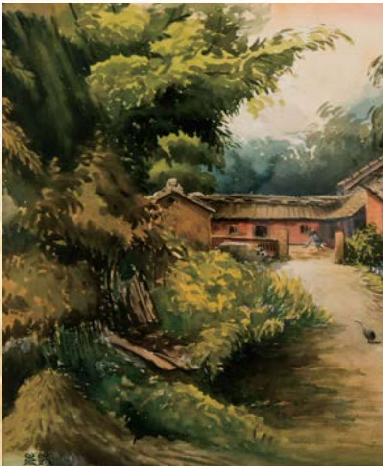
鄉村組曲 2013 水彩 57x48cm