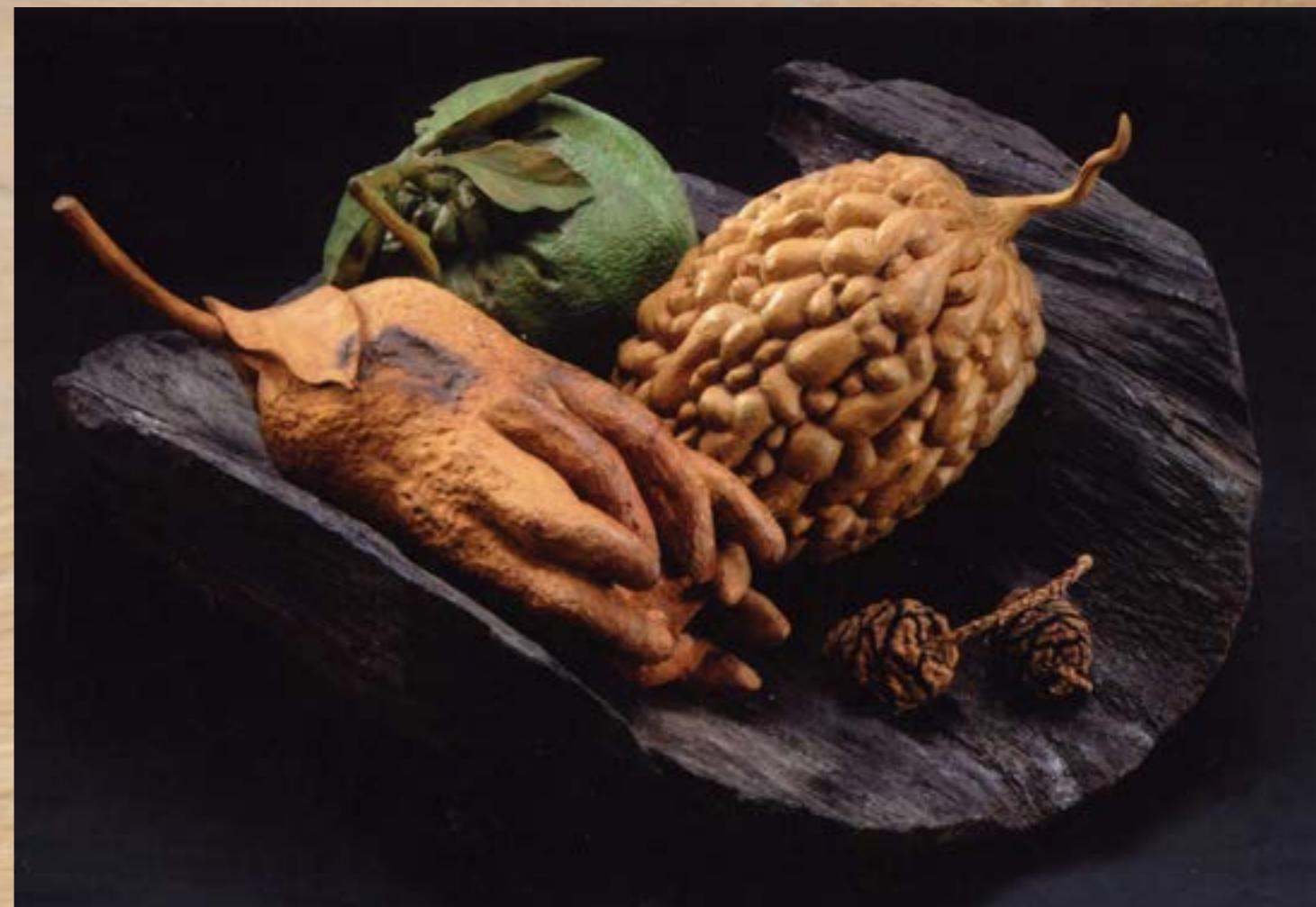
自然生態 - 多子多孫 2011 樟木木雕 41x30x21cm D17

文建會傳統藝術藝人、大葉大學駐校傳藝計畫老師 獲邀台灣國際蘭展—蘭花工藝品展 獲邀國立台灣工藝研究所個展 獲邀國立台灣工藝研究所「工藝之家」聯展 獲邀蘭為王者香「2006 蘭花工藝展」 獲邀臺南市立文化中心個展 獲邀多倫多及溫哥華台灣文化節 個展： 「台灣工藝展」獲邀三義木雕博物館個展 2007 獲邀彰化市藝術館個展； 嘉義市文化局、嘉義市立博物館、 台中市立文化局邀請展 2008 獲邀高雄市立歷史博物館、國立彰化師範大學、 台北社教館、欣榮紀念圖書館個展 國立歷史博物館「生命之歌—黃媽慶木雕展」 彰化市福山寺「生耕致富 黃媽慶木雕展」 員林鎮公所「刀裡乾坤 黃媽慶木雕邀請展」 著作：個人作品集五冊