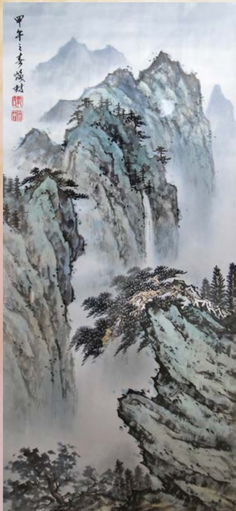
山水 2014 水墨 93x42cm

畢業於台灣師範大學美術學系 從事美術教育四十餘年退休， 現為專業畫家。 應邀彰化縣美術家接力展第九棒 現為彰化縣美術學會評議委員 東南畫會會員 從事油畫、水墨畫創作與教學。