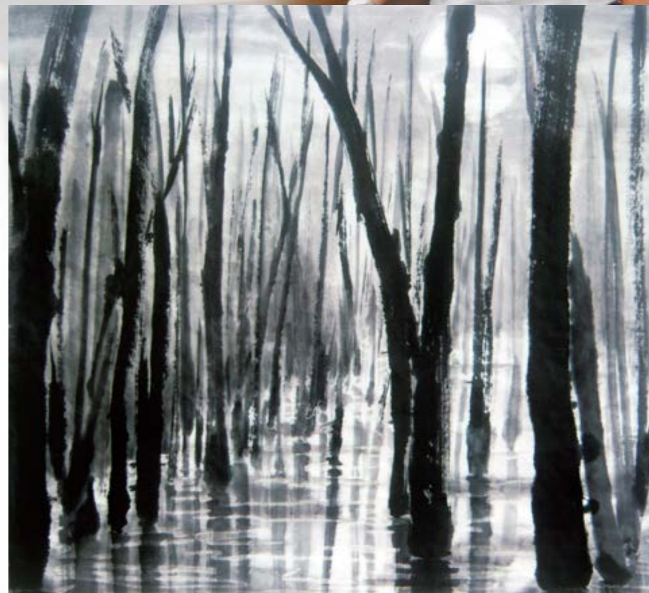
忘憂 2012 水墨 70x70cm

現任： 彰化縣美術學會會計、雲林寫生研究會常務監事、 雲林濁水溪書畫學會理事、 雲林美術協會及青溪新文藝學會會員 鐵路局勞教中心國畫班 雲林古坑谷泉咖啡書畫班指導老師 獲獎： 入選彰化、雲林美展數次 交通機構書畫展特優、佳作 展覽： 彰化文化局個展、台北台中火車站個展數次、 雲林文化局父子聯展