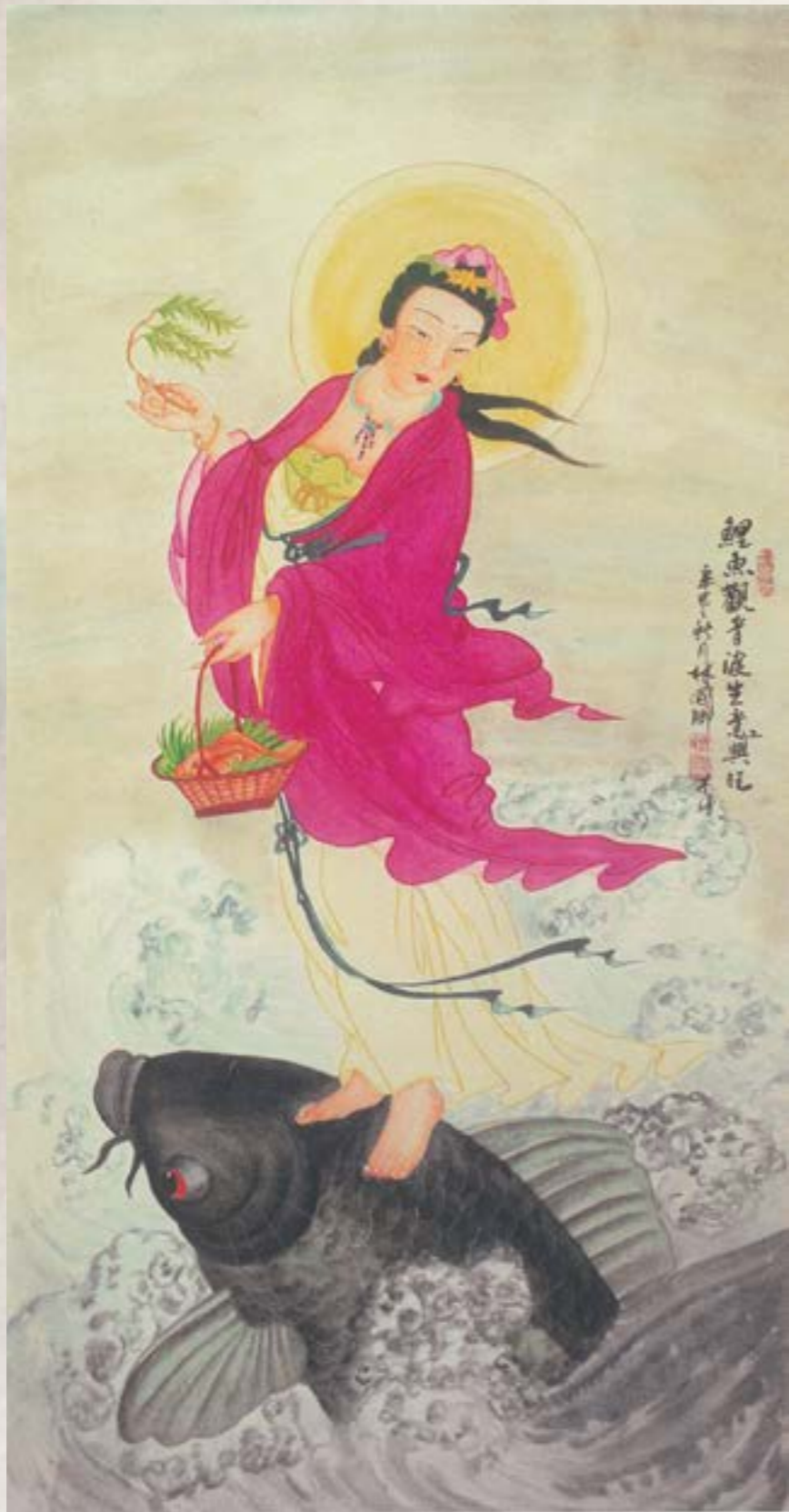
鯉魚觀音 2001 宣紙 全開

藝術生涯 40 餘年， 獲入台陽美展， 中部五縣市、津島市長獎， 大日本書藝院特選獎等高獎， 1981 年入世界藝術展， 個展於省立社會教育館 2 次， 深受社會收藏家所珍賞。