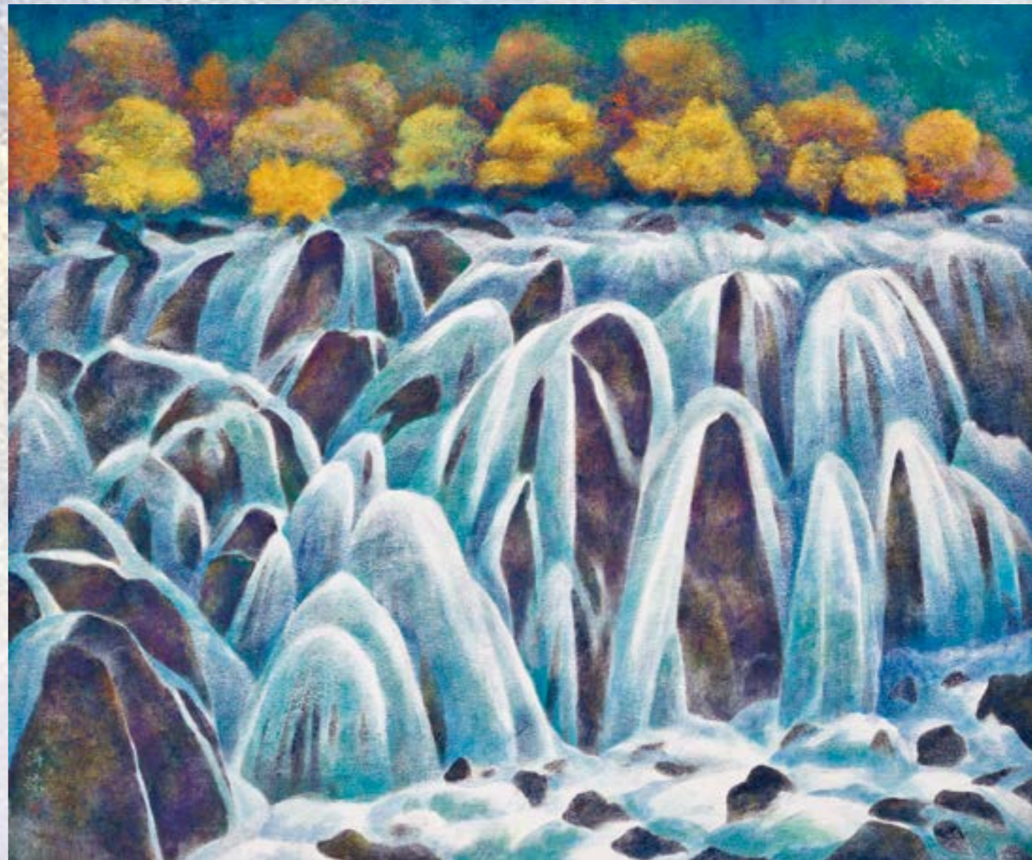
疊瀑 膠彩 20F D13