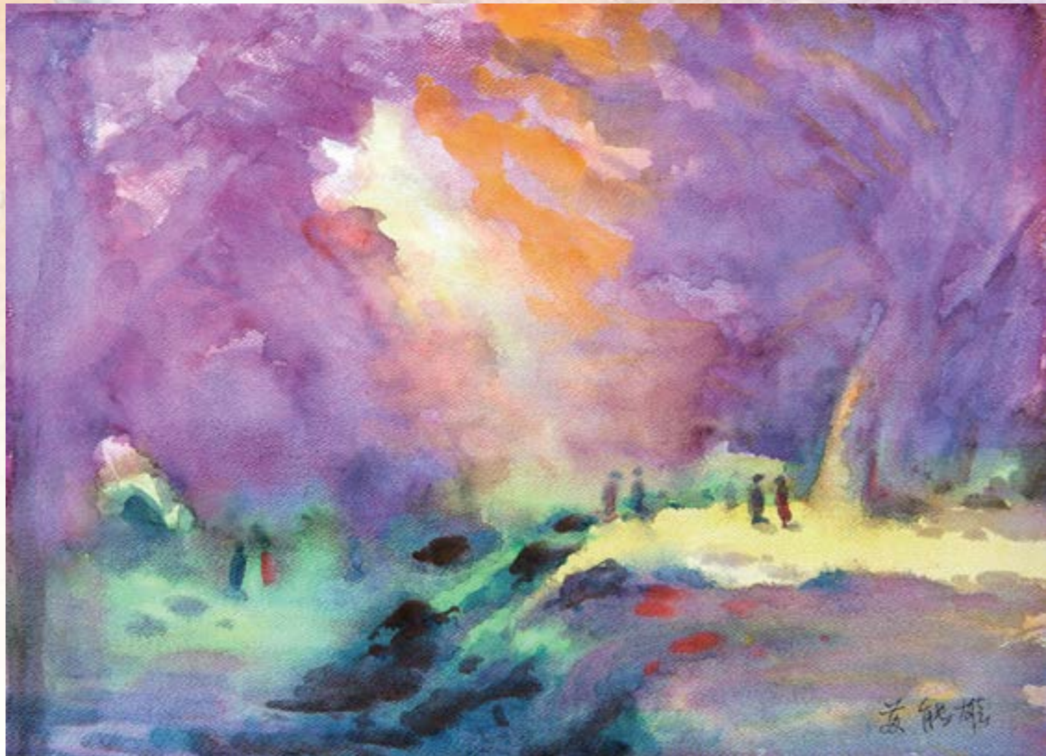
櫻花武陵 2013 水彩 39x54cm

國立藝專美術科畢 曾任國、高中美術教師 曾加入中部美術協會、春秋畫會、中部水彩畫會 現為彰化縣美術學會監事，美術工作者。