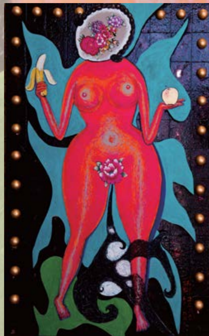
女門神 2010 複合媒材 160x100cmx2(左、右)