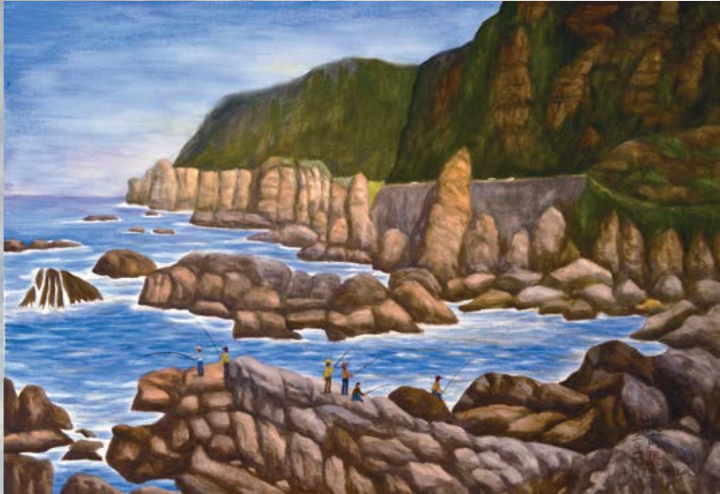
台灣東北角 2011 水彩畫 75x106cm