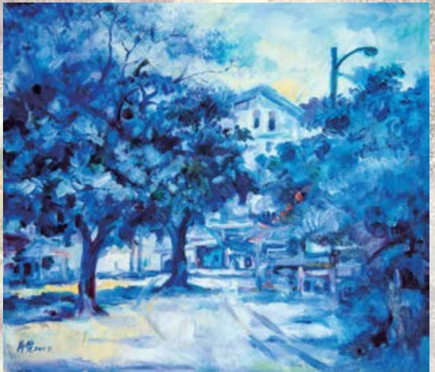
暮色 2011 油畫 10F

國立藝專美術科西畫組畢業 1995 年加入彰化縣美術學會 曾任彰化縣美術學會總幹事、常務監事 現任彰化縣美術學會監事 道東畫室、彰化縣私立發現藝術幼兒園創辦人