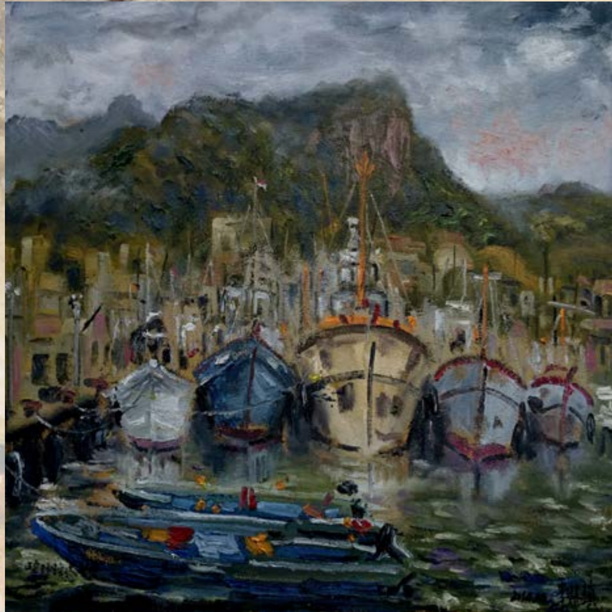
碧砂漁港 - 秋魚 2014 油畫 240x240cm

生於彰化縣 國立台中高工素描指導老師 台中縣山線社區大學油畫指導老師 5 年 六合油畫會會長、西北畫會會員、薰風畫會副會長 台中市美術教育協會理事、台中市油畫家協會常務理事 台中縣葫蘆墩美術研究會常務理事 台灣藝術家法國沙龍美術協會組長、員青畫會常務理事 彰化縣美術協會理事、彰化同鄉會美術聯誼會會員 2006 參加 A-21 ART 國際美術交流展於大阪美術館 100 號展出 2007 鯨魚廣州順德個展，展出 50、30、20 等 50 餘幅作品 個展 10 餘次聯展數百次 受邀礮溪百年百畫名家聯展、彰化縣建醮 290 週年聯展 2012 廣東省河源市立美術館個展、2014 受邀彰化美術館落成首展