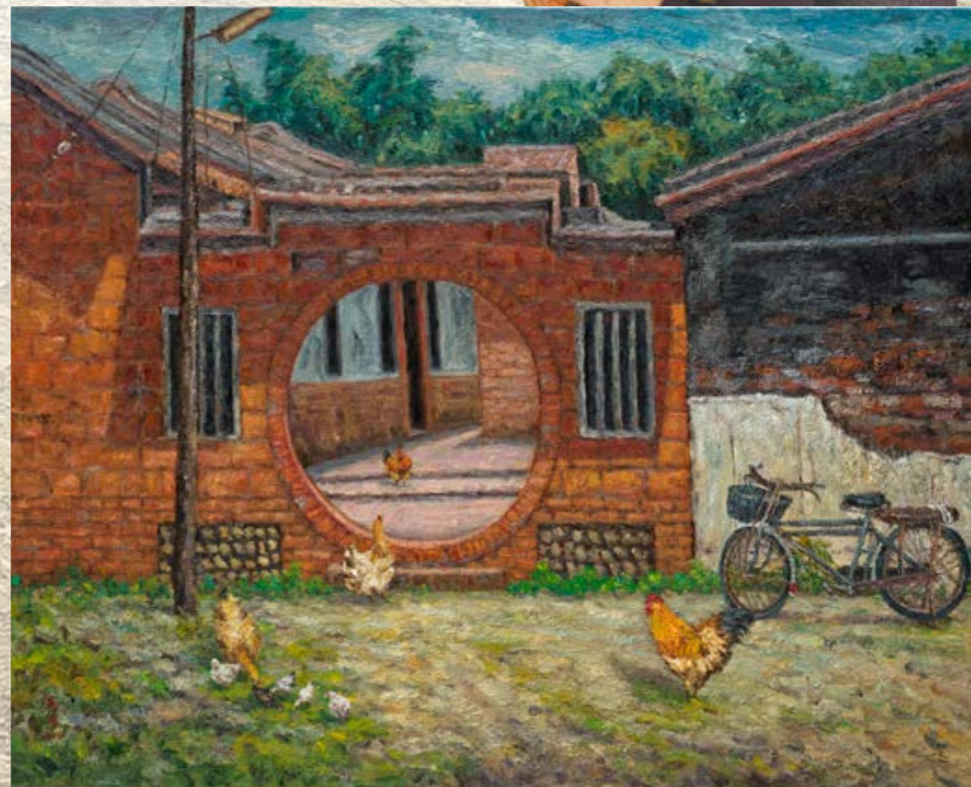
古厝的一角 (益源古厝) 油畫 30F