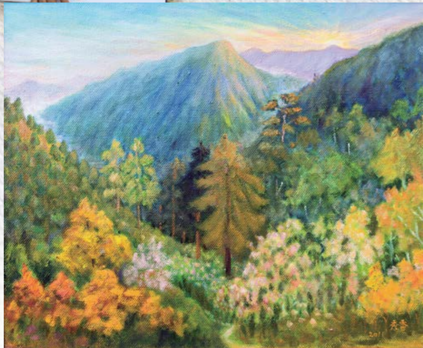
玉山東峰 2011 油畫 20F

創作畫題： 為了妝點枯燥的山林，上帝創造了嬌艷的花，色彩繽紛，目不暇給。為了妝扮平凡的山木，上帝賦予我藝術的雙手，畫下美麗的回憶。