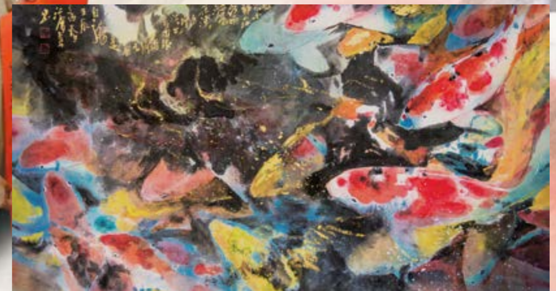
滿池錦麗 2012 水墨 60x120cm

美術坊負責人、墨風堂主人 彰化縣美術學會理事、員林美術坊負責人 獲獎： 中部美展第一名 大墩美展、台陽美展、玉山美展、磺溪美展入選及佳作