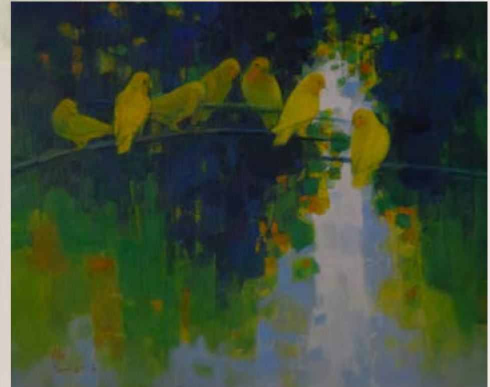
小鸚鵡 2013 油畫 15F

生於鹿港，台中師專畢業。 曾獲中部美展一、二名； 省公教美展油畫專業組一、二、三名； 全省美展油畫第二名。 個展多次。