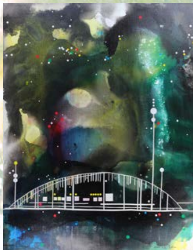
七夕傳說 2014 複合媒材 50F

出版：黃明山畫集二冊 作品「蘆海秋意」國父紀念館典藏 「守著冬天等待著春天」彰化縣立文化局典藏