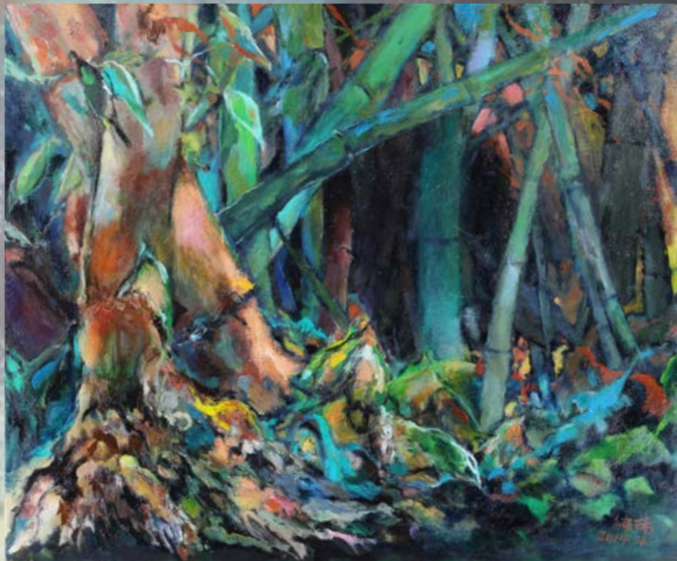
寒竹新筍 2014 油畫 20F D22

創作自述：以所見所思為作畫主題，融合具象與抽象的方式，運用堆疊、噴灑、滴流的技法，為自己的藝想築夢。