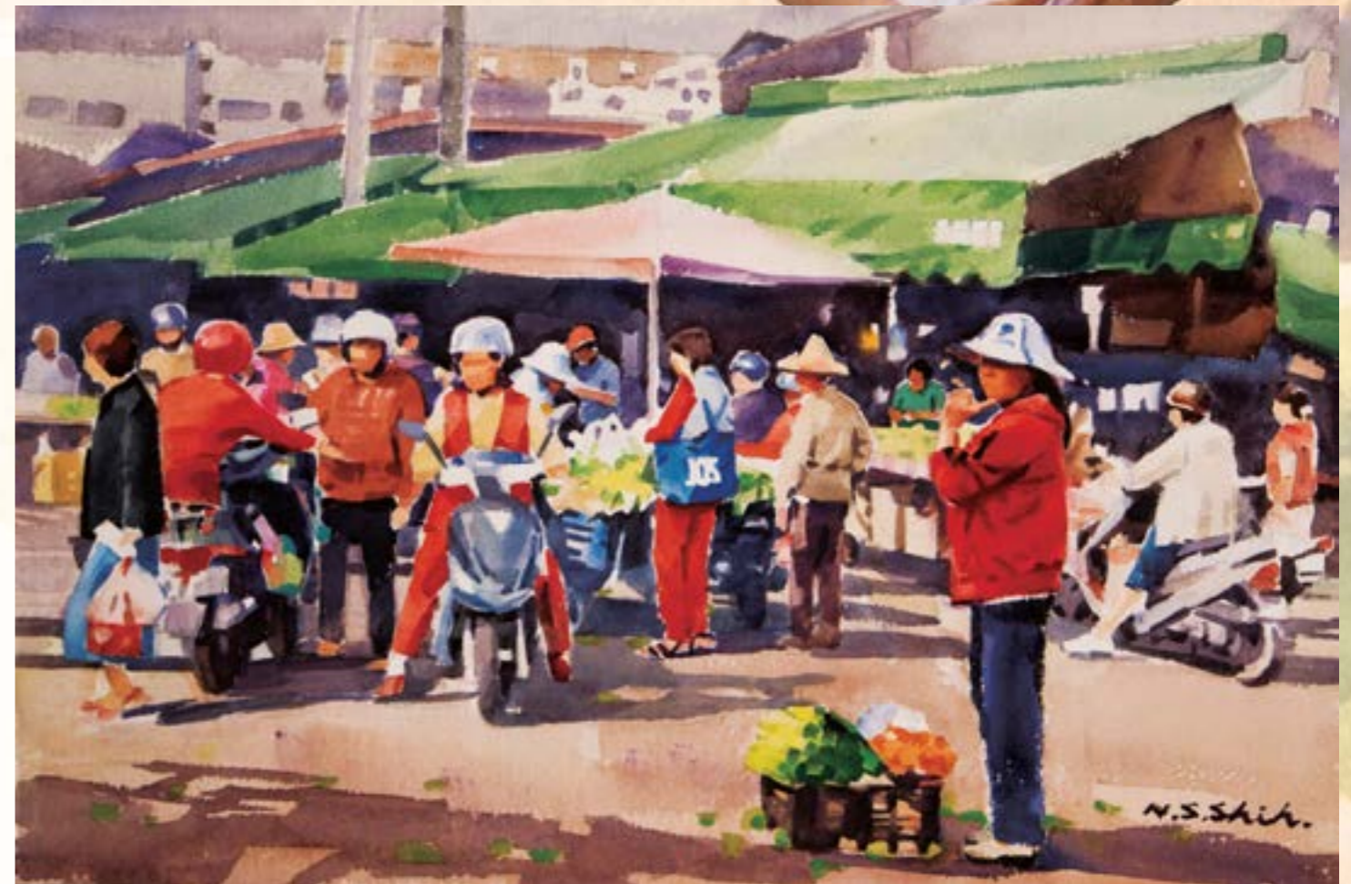
市集 2000 水彩 38x56cm

國立台灣師範大學美術系畢業 日本水彩畫會、中華水彩畫協會及台灣國際水彩畫會會員 曾應邀參加全國美展及第1、2、3屆中華民國水彩畫展 個展九次，聯展百餘次 曾獲師鐸獎及文化杯金獅獎。