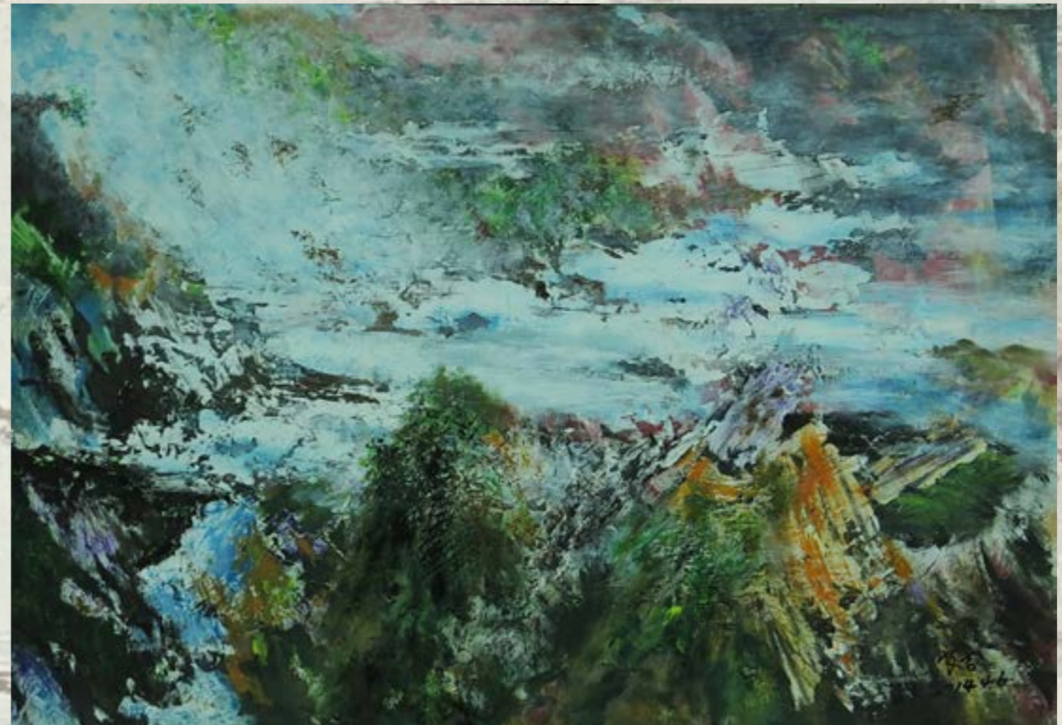
夢境雲深 2014 壓克力水彩 對開

學生時代於彰化中學初中時參加多次縣運田徑賽及中上省運動會。 國立政治大學銀行系畢業後， 改入「華南銀行」迄民國九十五年服務將近 40 年， 經理退休後專心作畫、攝影及登山等休閒活動。 三十年前加入彰化縣美術學會前身「彰化縣美術教師聯誼會」， 不久參與成立「彰化縣美術學會」， 此後多次參加「彰化縣美術家聯展」及歷次學會會員聯展迄今。 擔任華南銀行和美分行經理時， 應邀於「和美國小百週年校慶」活動中舉辦「西畫個展」。