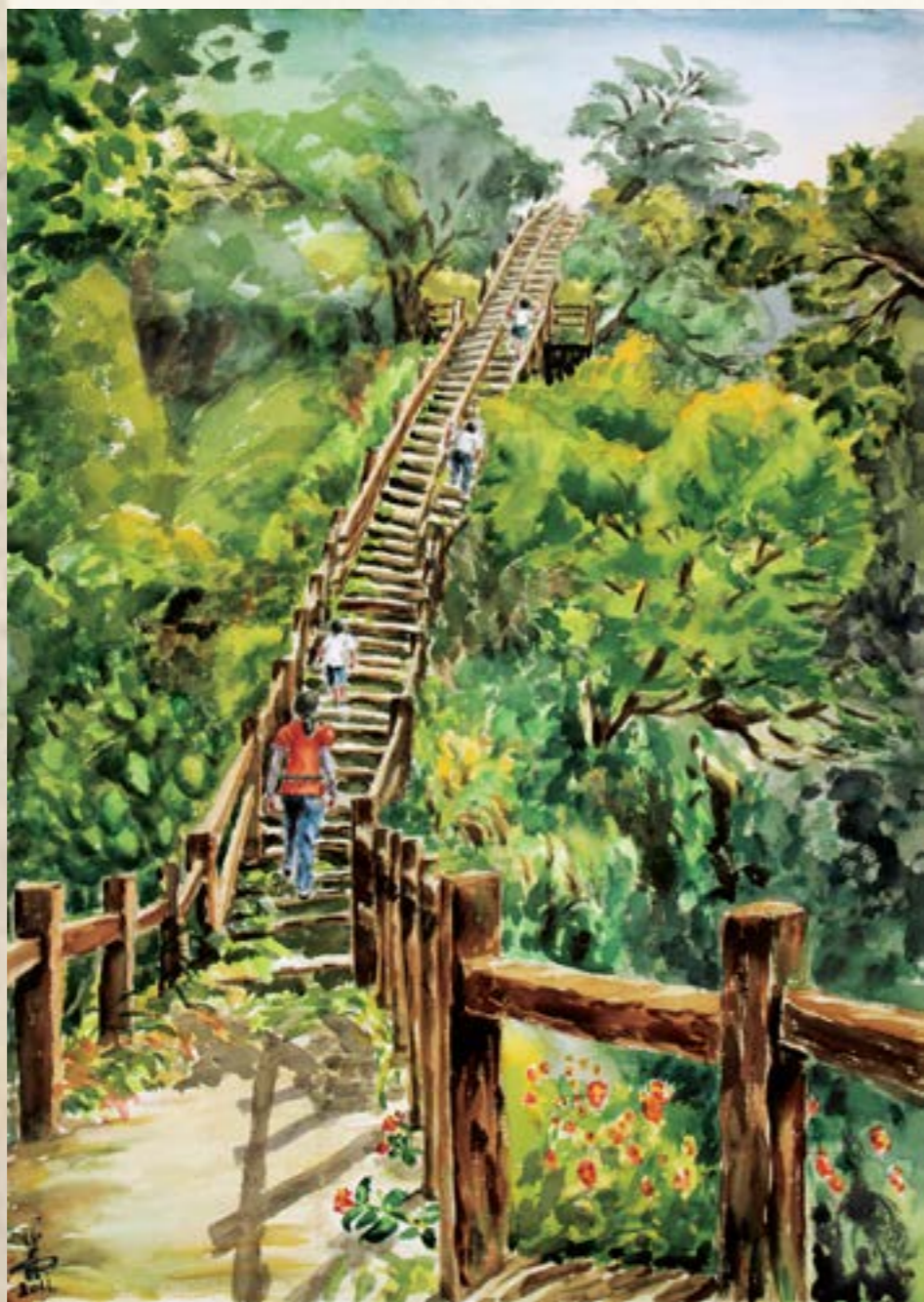
步步高昇 (清水岩擎天梯) 2011 水彩 105x75cm

員青藝術協會常務理事 彰化縣美術學會監事 拓展文教基金會董事 卦山畫會理事 1994 於長芬畫會由張煥彩老師啟蒙指導 2007 獲彰化市百畫藝術家殊榮 2001~2012 個展 9 次 2001~2013 聯展數次 2013 國際交流展於彰化市、香港、紐約參展