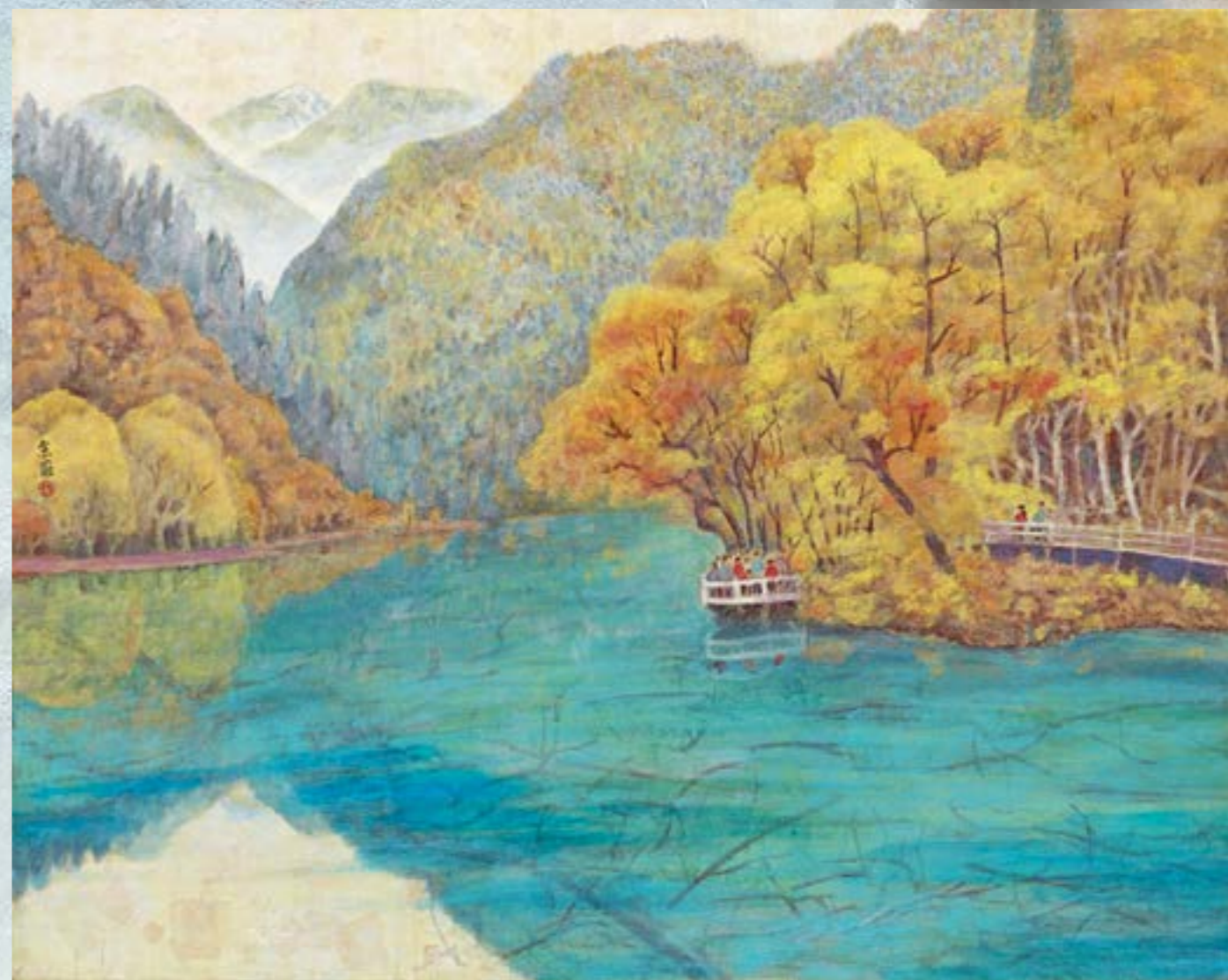
五花湖(九寨溝) 2012 膠彩 30F D3