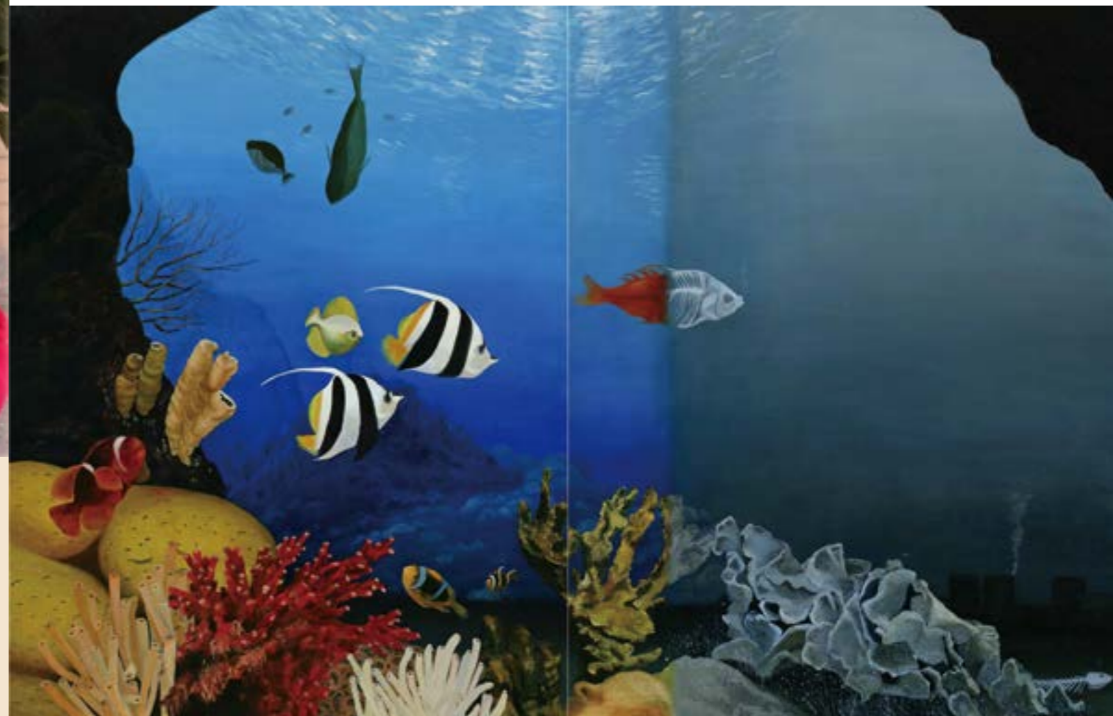
浩劫 1 100P 2015 油畫