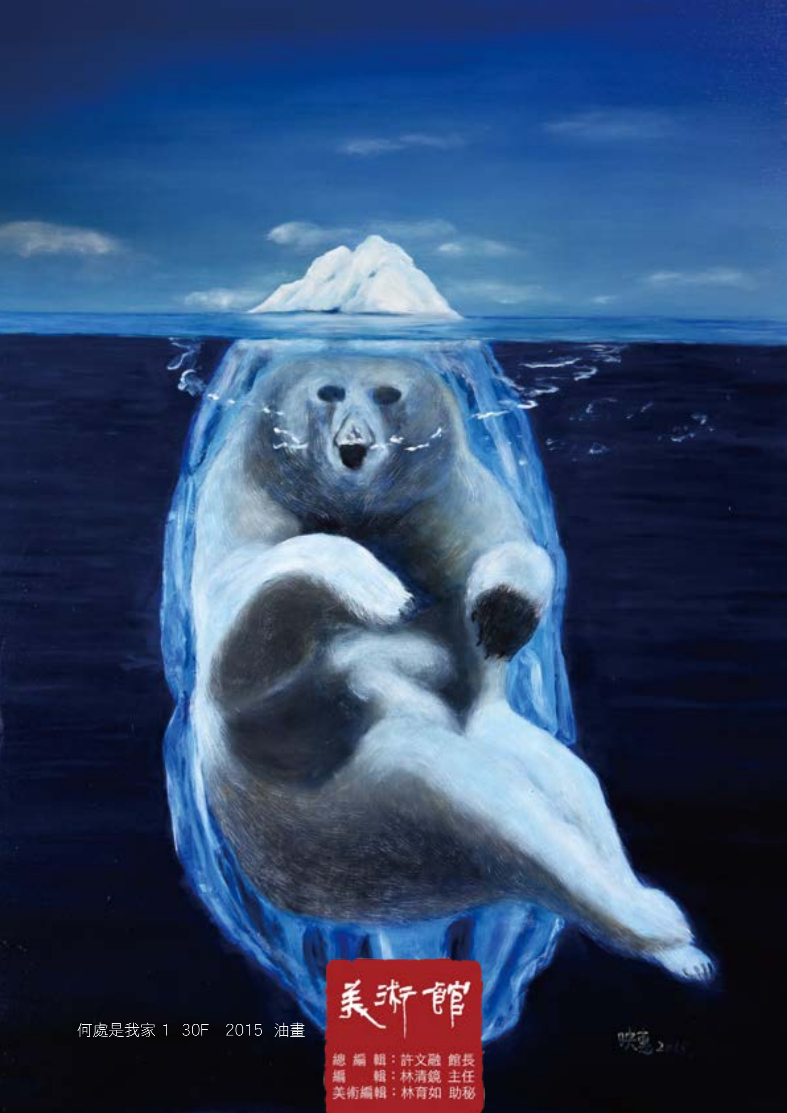
何處是我家 1 30F 2015 油畫