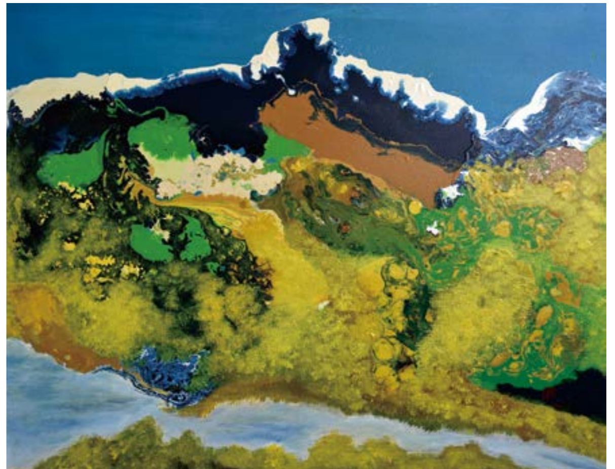
遠眺雪山(二) 30F 2016 壓克力.油彩