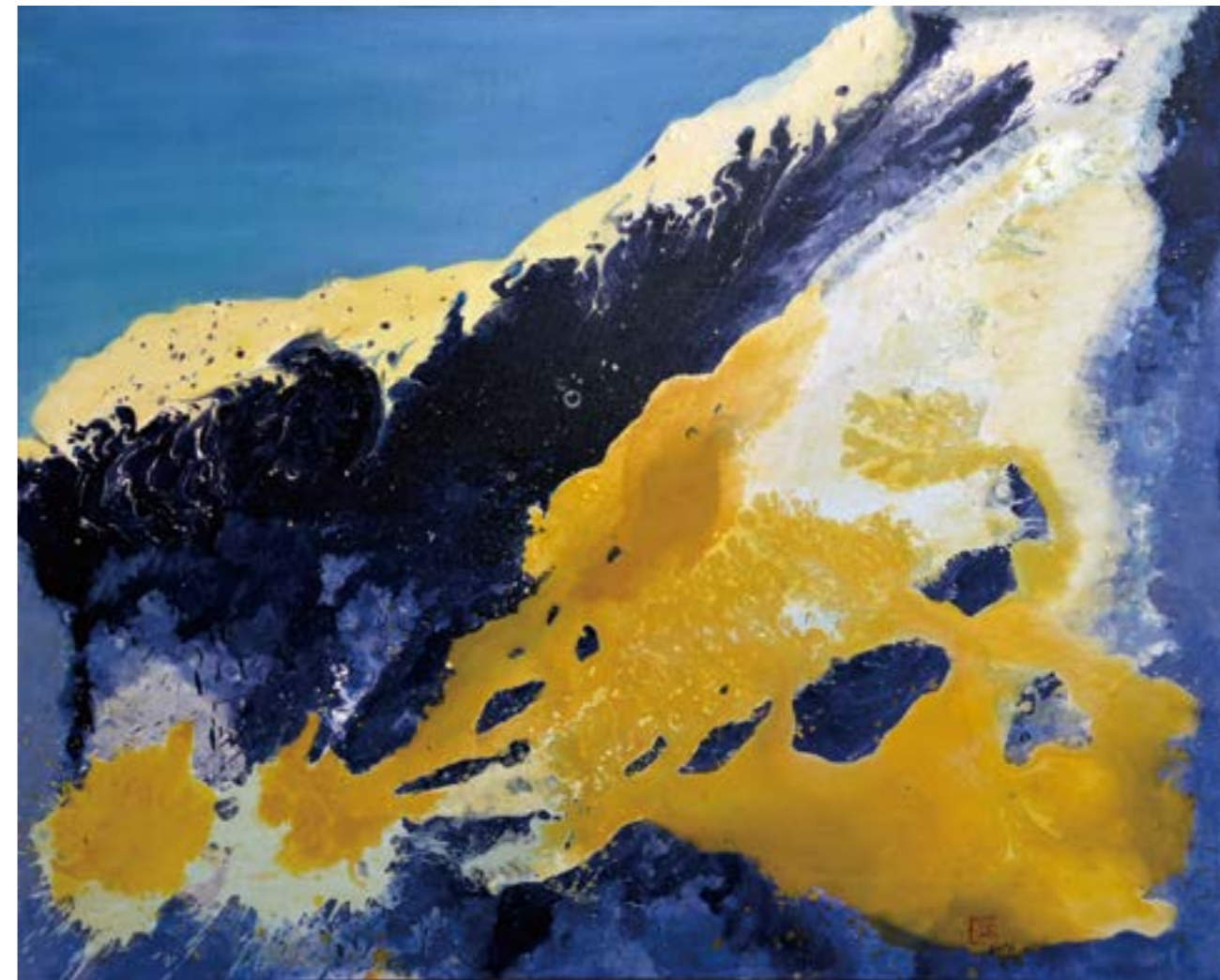
移動雪山 30F 2016 壓克力.油彩