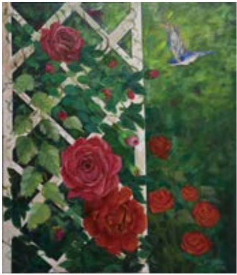
花系列 1 10F 2018 油畫