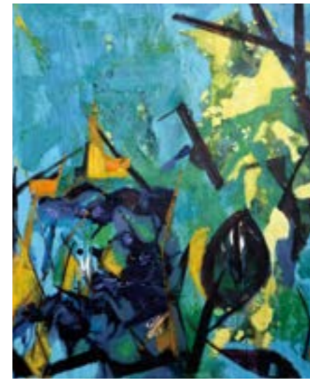
自然的樂章 20F 2015 壓克力.油彩