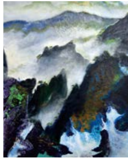
黃山-飛來石 30F 2016 壓克力.油彩