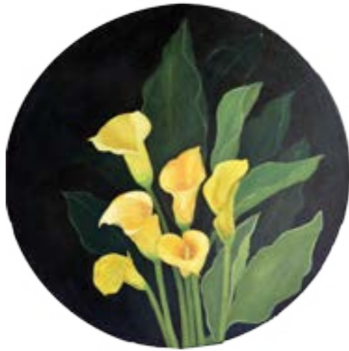
黃海芋 50cm 2019