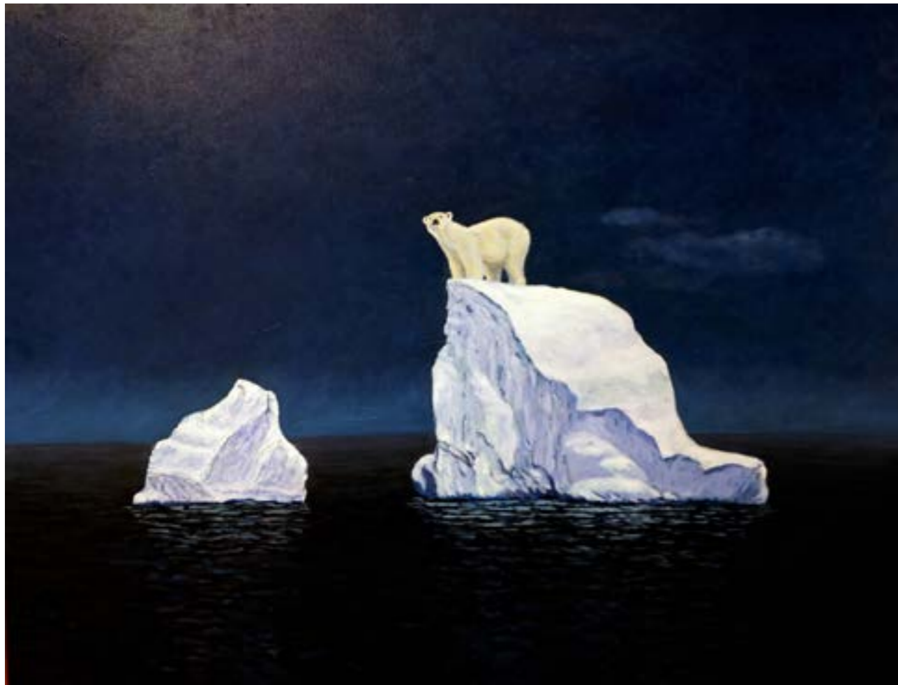
何處是我家 3 10F 2015 油畫