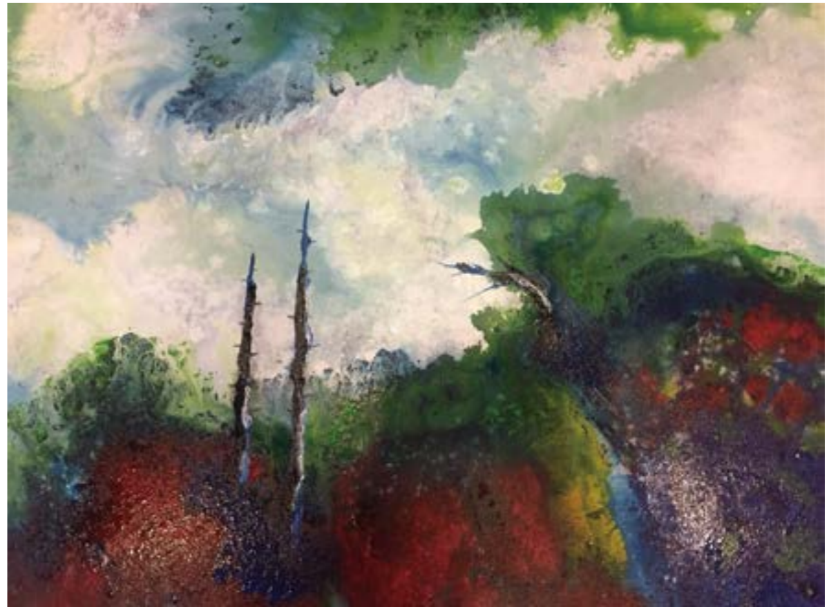
高山系列(一) 30F 2015 壓克力.油彩