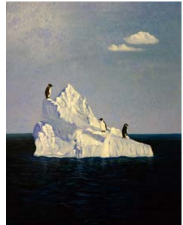
何處是我家 2 10F 2015 油畫