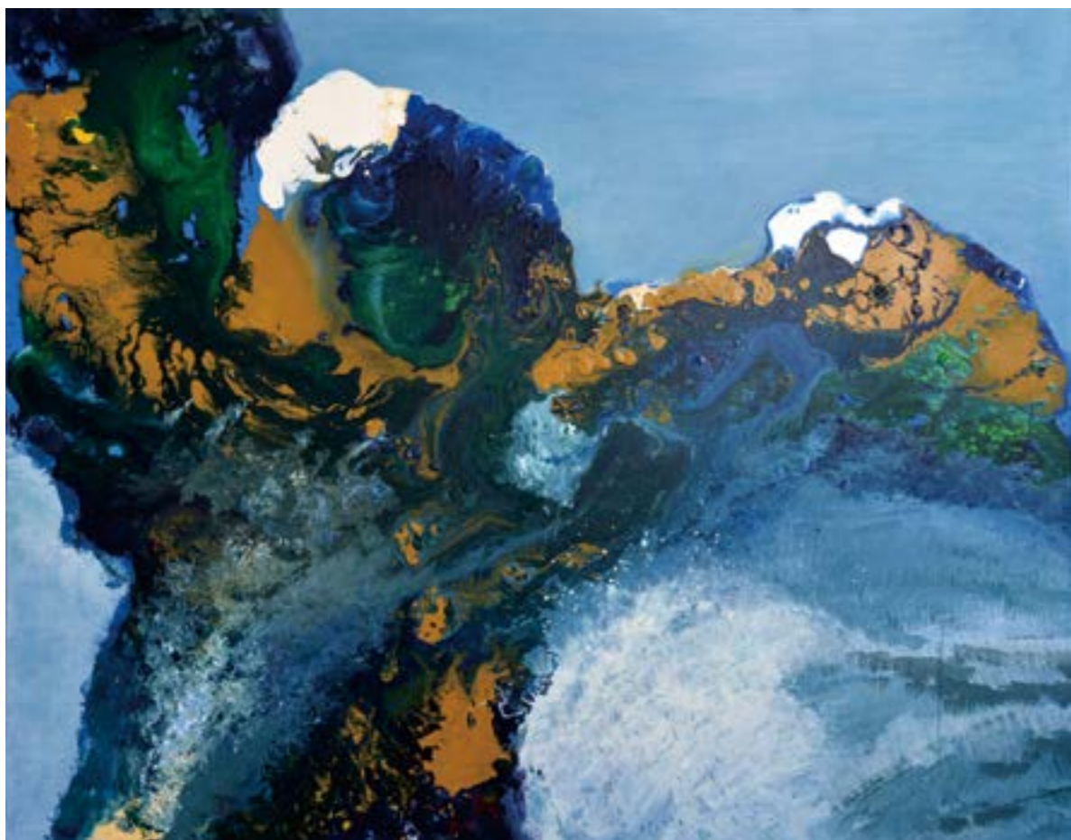
遠眺雪山 30F 2016 壓克力.油彩