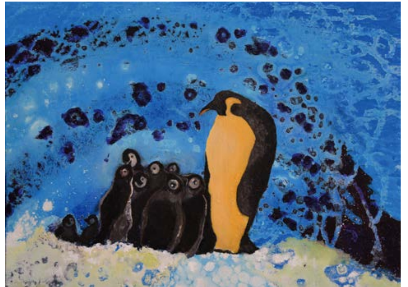
何處是我家 4 8F 2019 油畫