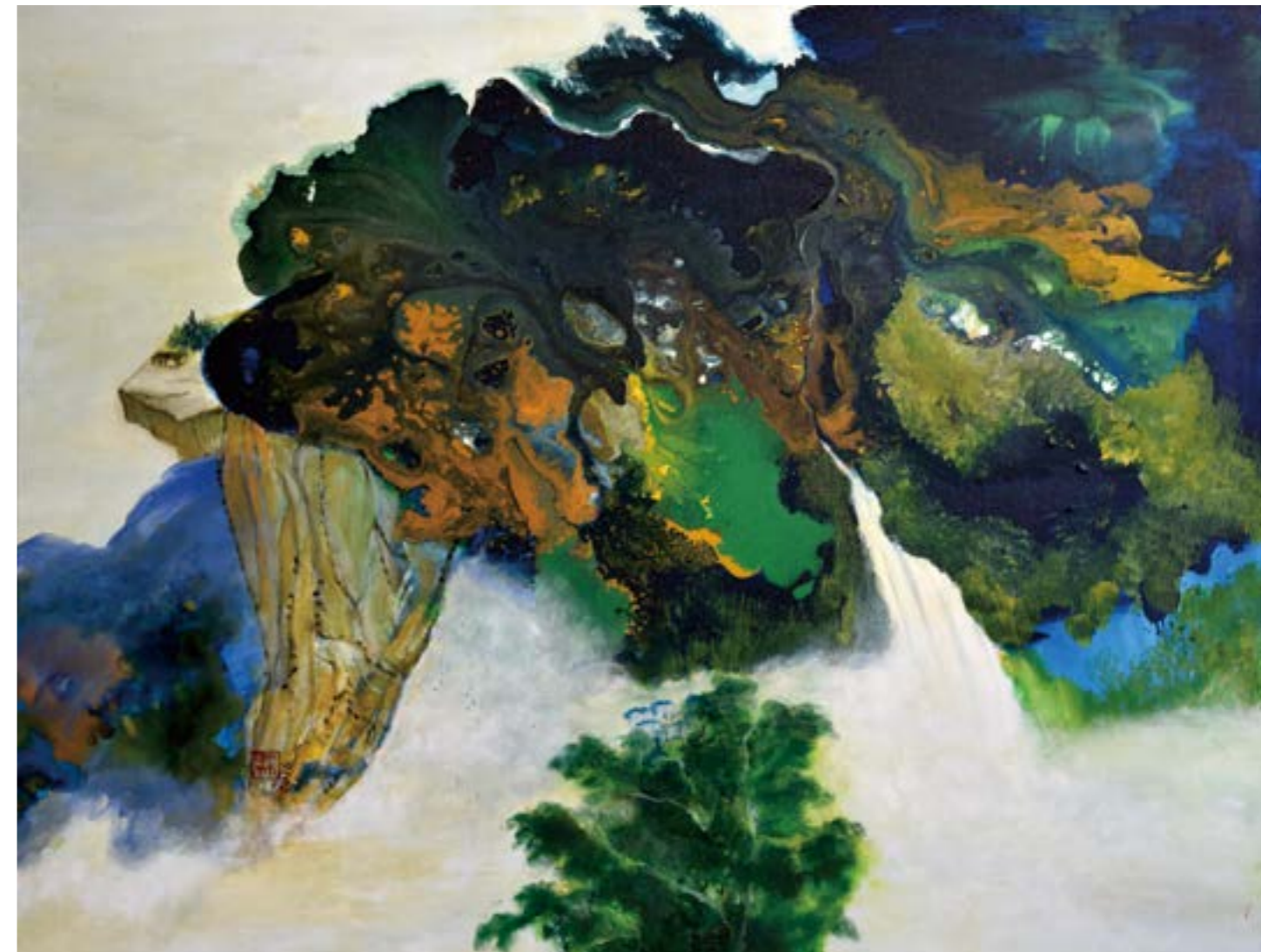
山居歲月 30F 2016 壓克力.油彩