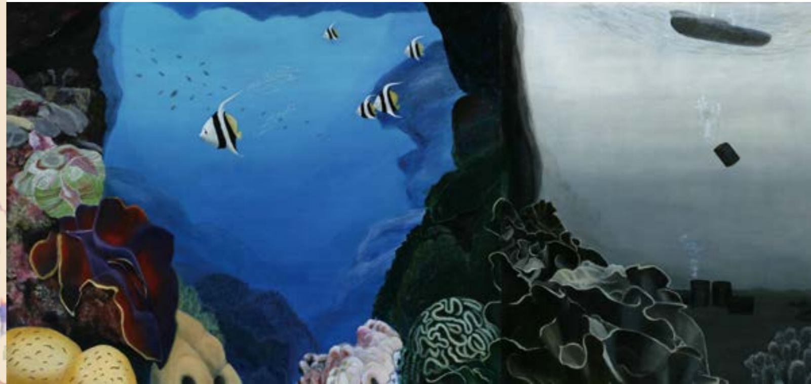
浩劫 2 65P 2015 油畫

這些生態環境的變化是個人創作繪畫過程中所關注的議題，大自然現象它的趣味性和可探索性，是吸引個人以此為創作慾望，亦是作品中表達自我的重要語彙。