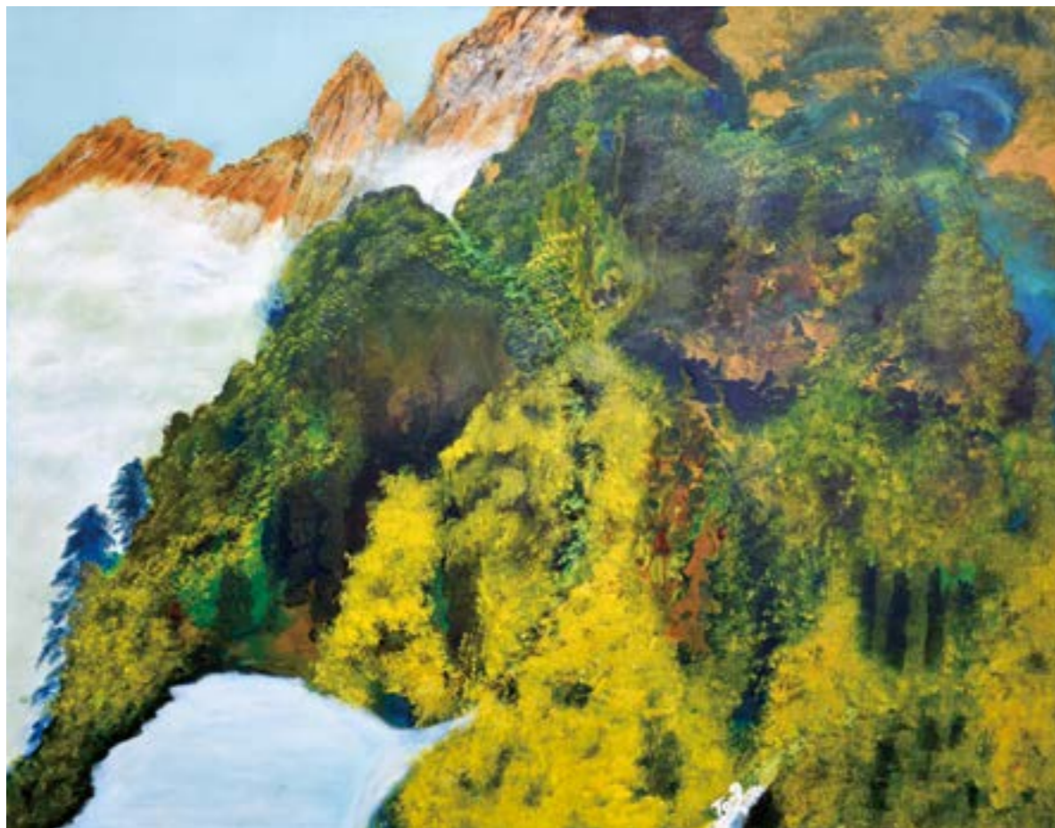
秋韻 30F 2016 壓克力.油彩