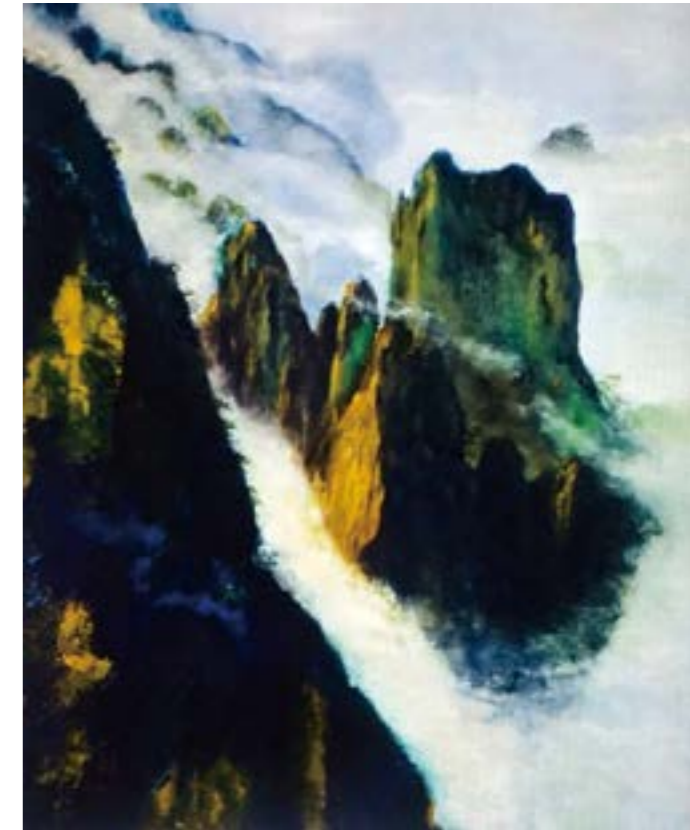
黃山雲海 30F 2016 壓克力.油彩