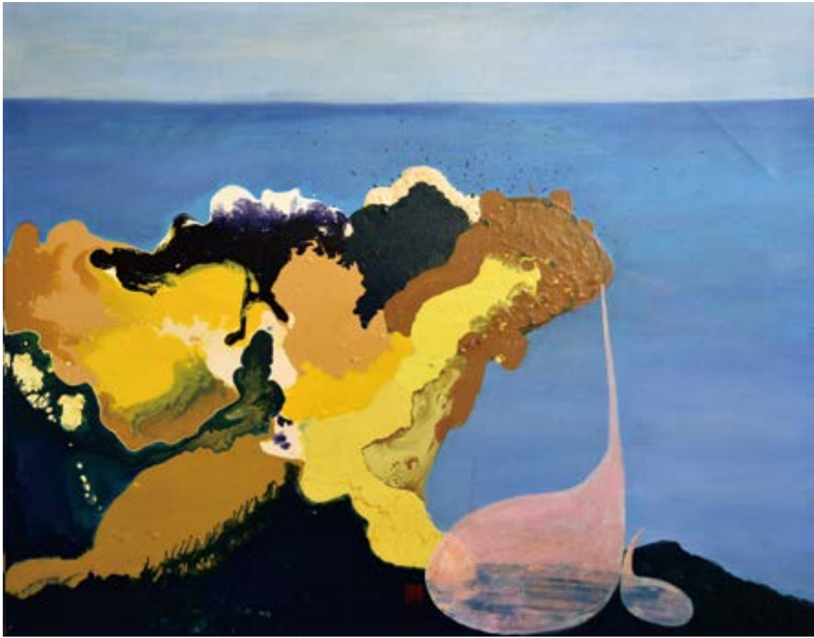
蘭嶼頌 30F 2016 壓克力.油彩