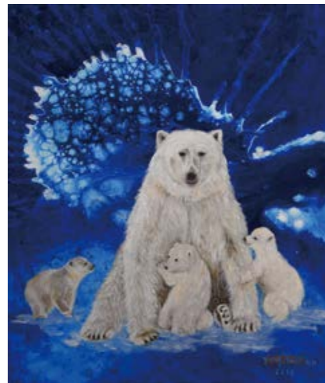
何處是我家 7 10F 2019 油畫