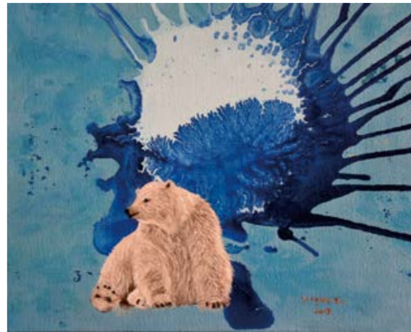
何處是我家 6 8F 2019 油畫