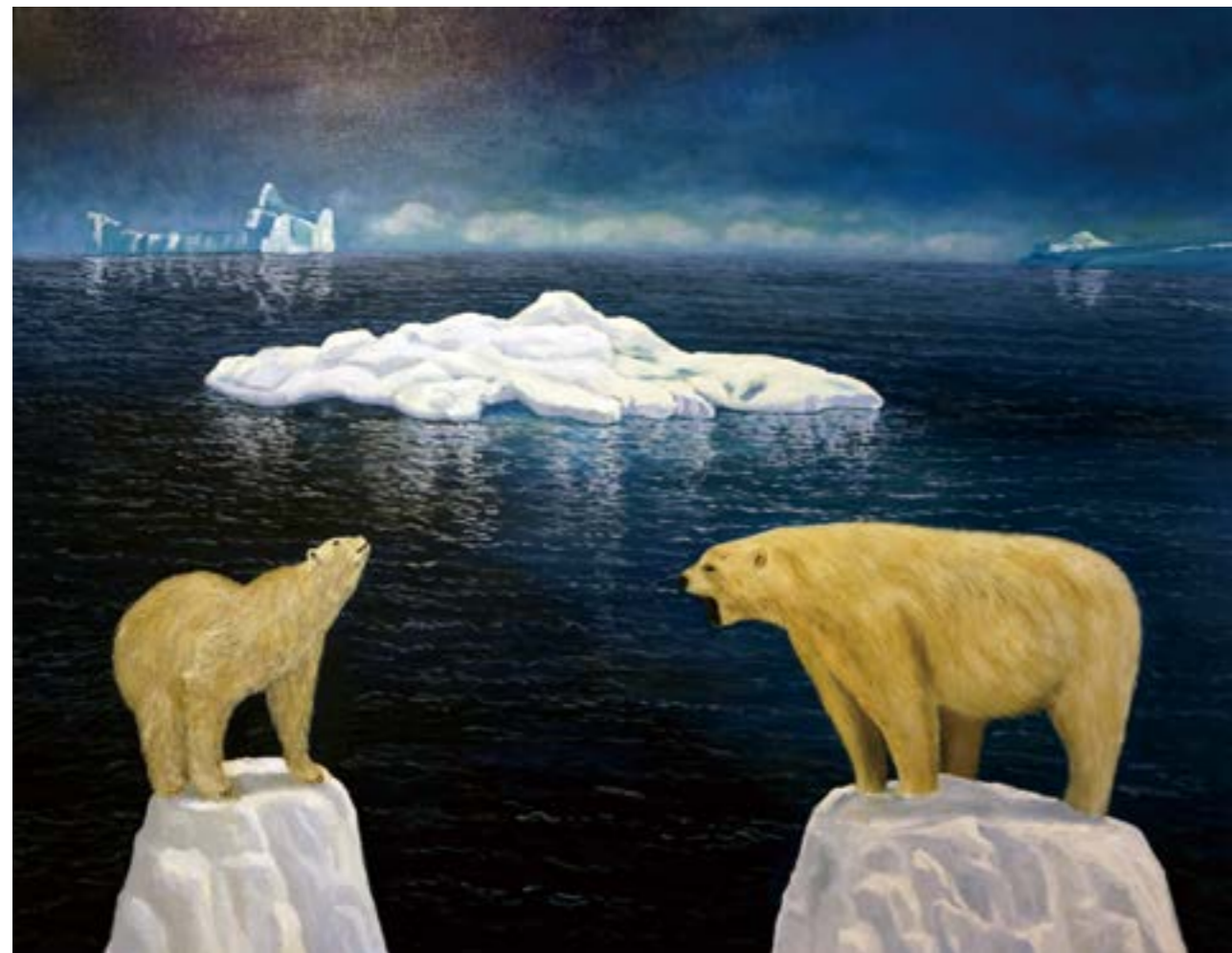
怒吼 50F 2015 油畫