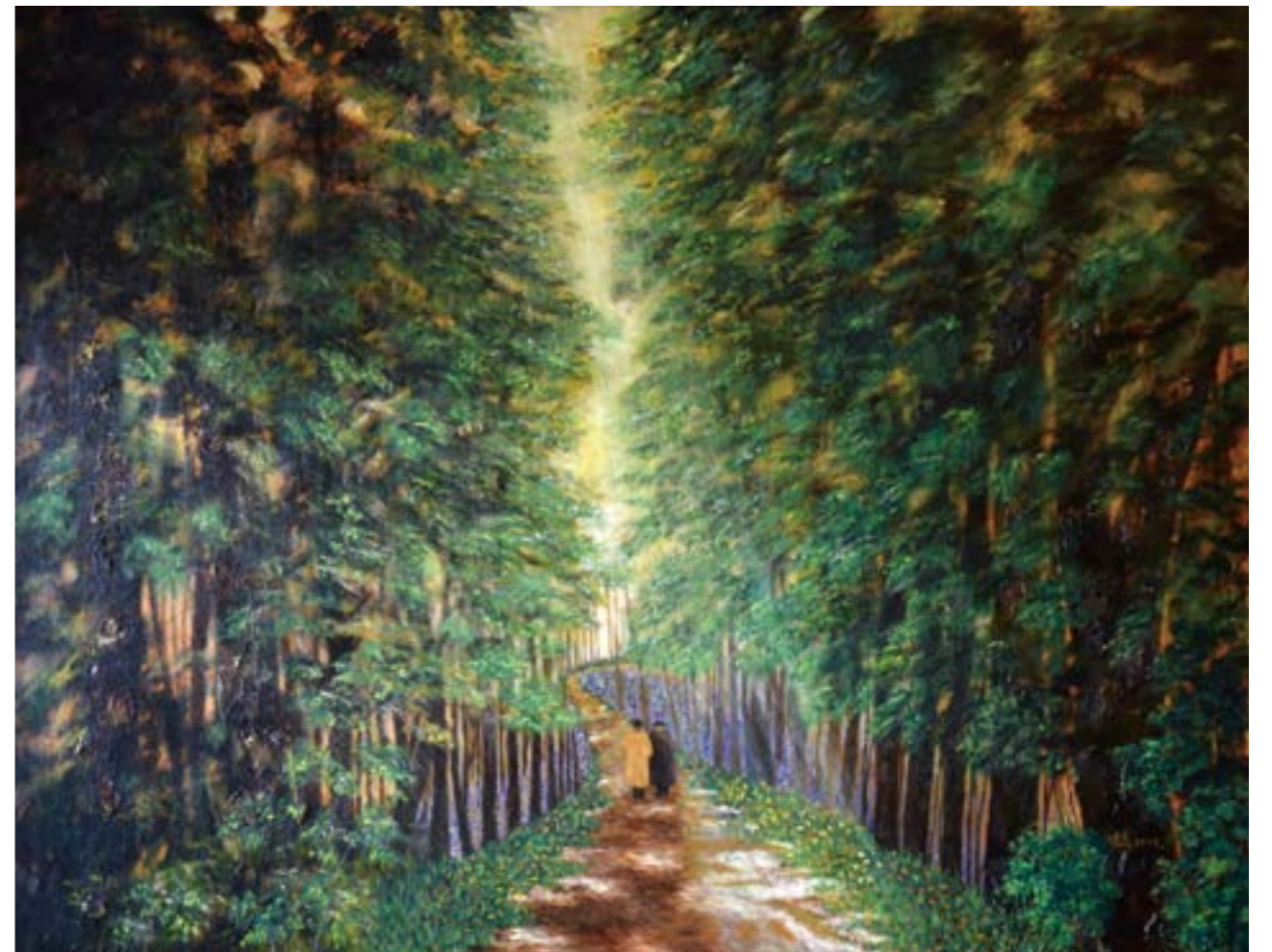
老伴 50F 2017 油畫