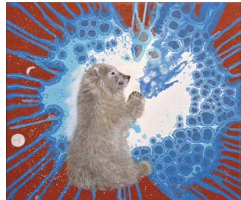
祈禱 10F 2019 油畫