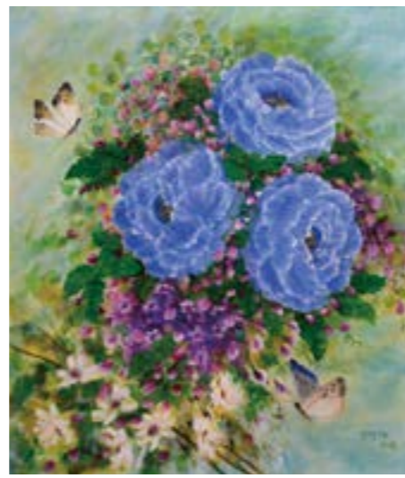
花系列 3 10F 2018 油畫