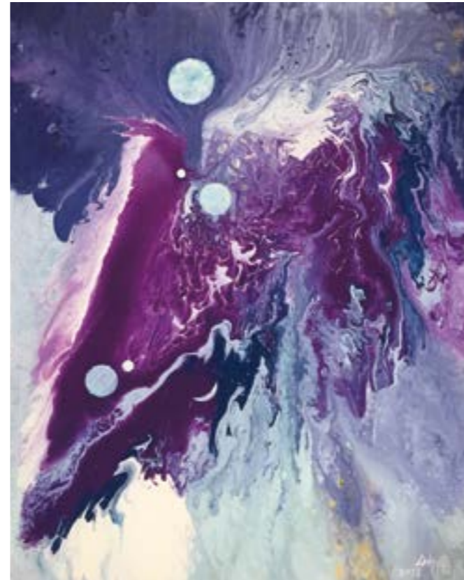
天目一宇宙系列（四） 30F 2018 壓克力.油彩