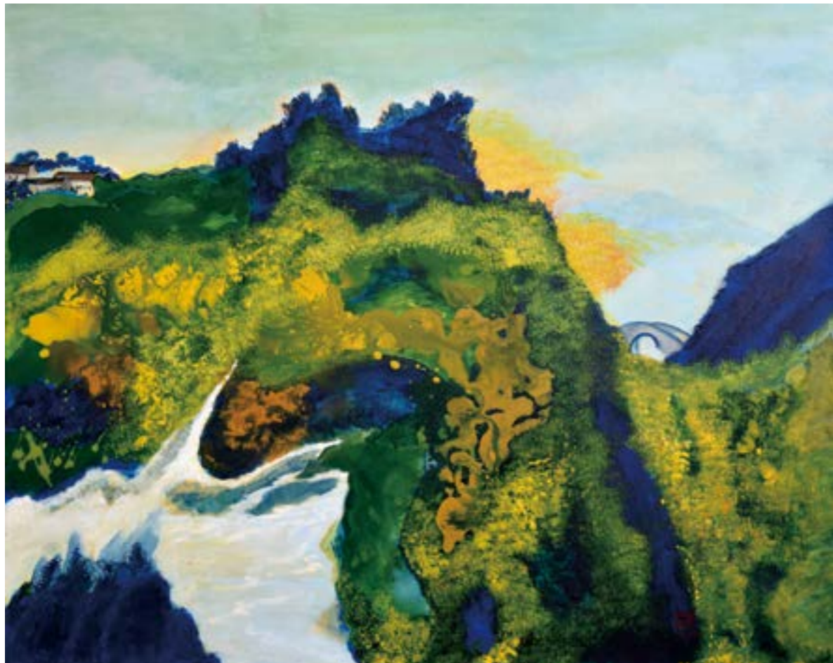
山居歲月（一） 30F 2016 壓克力.油彩