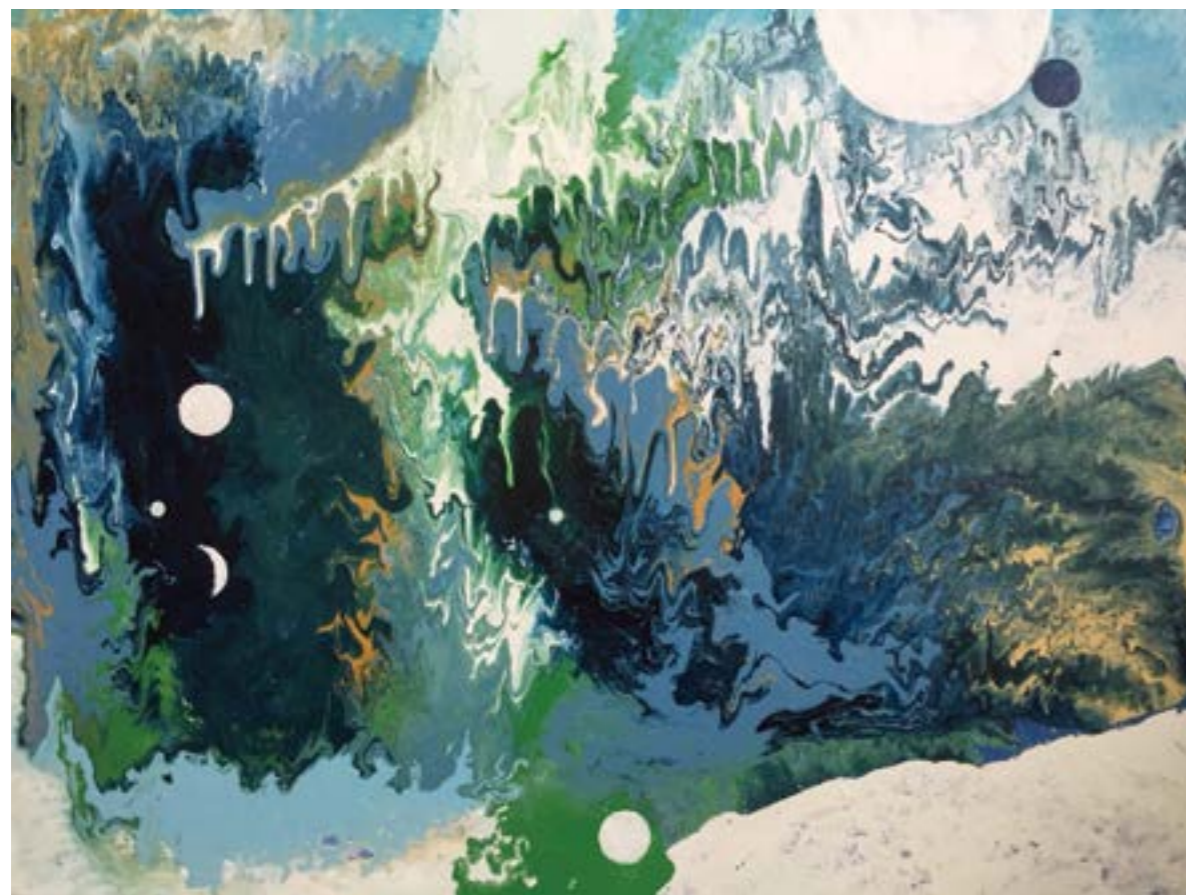
天目一宇宙系列(四) 50F 2015 壓克力.油彩