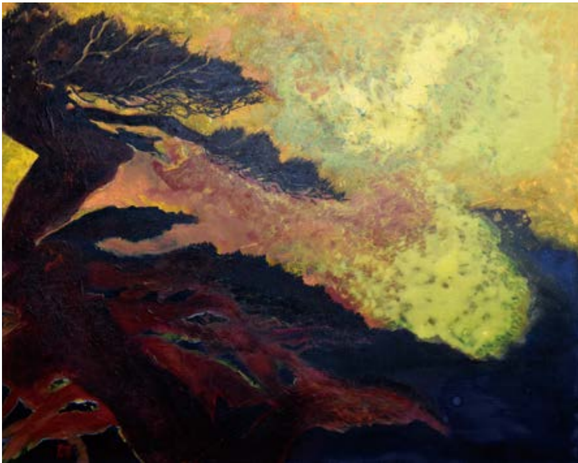
黄山騰龍 30F 2016 壓克力.油彩