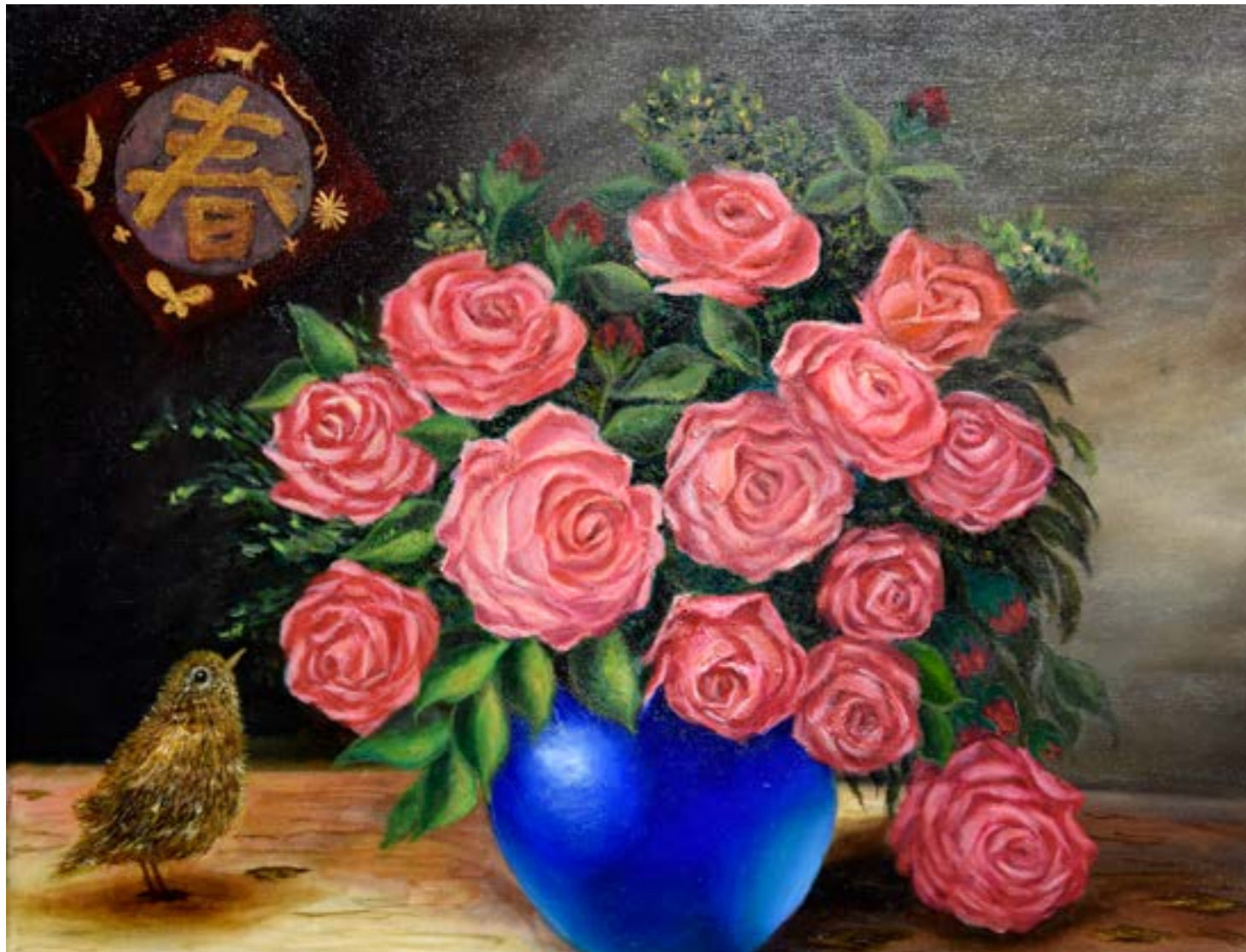
花系列 5 10F 2018 油畫