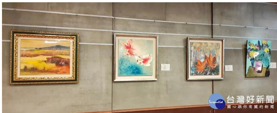
墨海藝術協會首展。

由一群喜愛藝術、熱愛鄉土、樂天知命，嚮往大自然隱逸田園生活，有著共同理想與抱負的藝術工作者組成的「台中市墨海藝術協會」，20日在彰化建國科技大學美術館，舉辦「大地情懷」台中市墨海藝術協會立案後首度的會員大展。