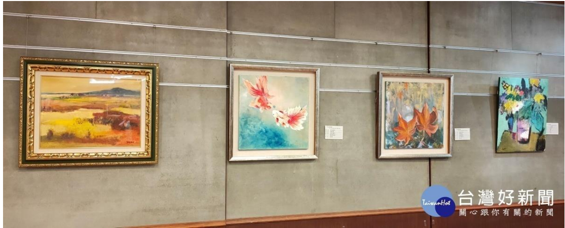
墨海藝術協會首展。