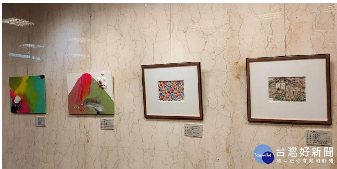
墨海藝術協會首展。