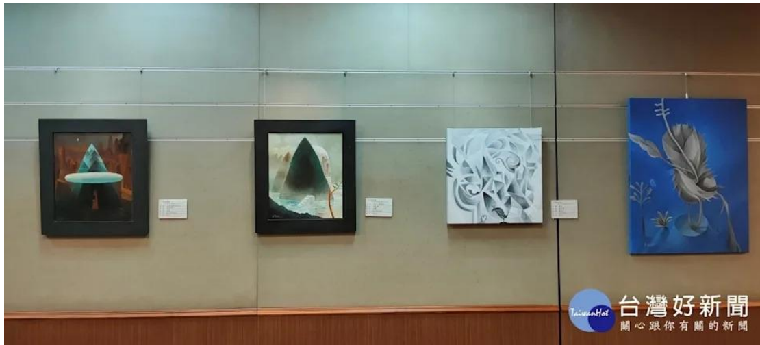
墨海藝術協會首展。

展出的作品非常多元，有水墨、書法、油彩、粉彩、複合媒彩、平面、立體雕塑等，這個剛申請立案通過的協會，會員有來自文化行政的官員、議壇的老將、司法界的精英、教育界與藝術界的前輩，及國內外各大院校系所畢業者，皆系各領域之佼佼者；會員不乏在國內各大比賽多次獲得重要獎項者。由於這是協會立案後首展出，會員除了把自己嘔心瀝血作品拿來參展外，開幕儀式，大家更是盛裝與會，有如在辦「生日趴」，十分熱鬧。建國大吳聯星董事長前往祝賀。