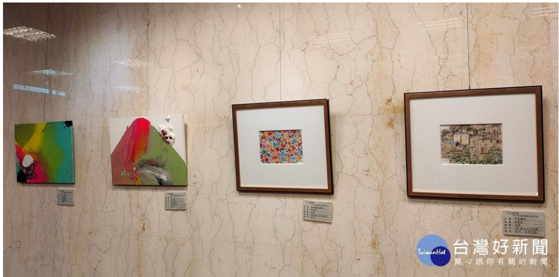
墨海藝術協會首展。