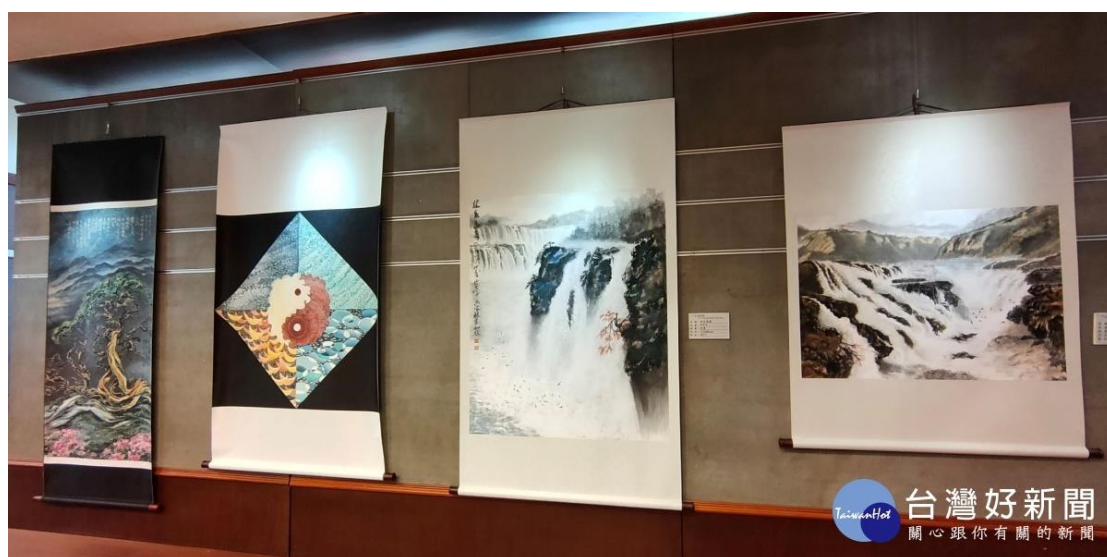
墨海藝術協會首展。

展出的作品非常多元，有水墨、書法、油彩、粉彩、複合媒彩、平面、立體雕塑等，這個剛申請立案通過的協會，會員有來自文化行政的官員、議壇的老將、司法界的精英、教育界與藝術界的前輩，及國內外各大院校系所畢業者，皆系各領域之佼佼者；會員不乏在國內各大比賽多次獲得重要獎項者。由於這是協會立案後首展出，會員除了把自己嘔心瀝血作品拿來參展外，開幕儀式，大家更是盛裝與會，有如在辦「生日趴」，十分熱鬧。建國大吳聯星董事長前往祝賀。